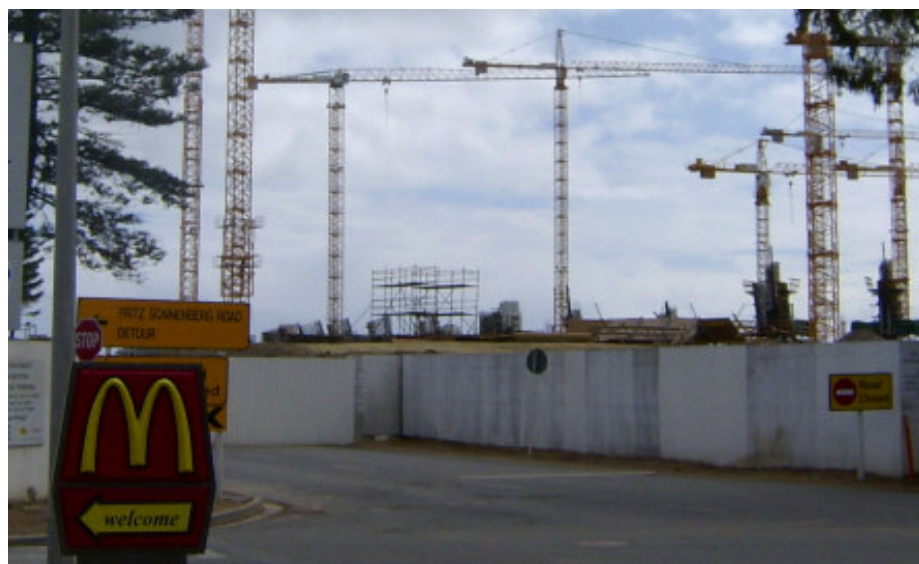
McDonald's Einfahrt vor der Baustelle des Kapstädter Fußballstadions für die 2010 WM.

Die Uniting Reformed Church in Southern Africa und die Evangelisch-reformierte Kirche in Deutschland verbindet nicht nur unser gemeinsames reformiertes Erbe, sondern auch der erfolgreiche Kampf gegen das Apartheidsregime in den achtziger Jahren. Zunehmend setzt sich jedoch sowohl in Südafrika als auch in