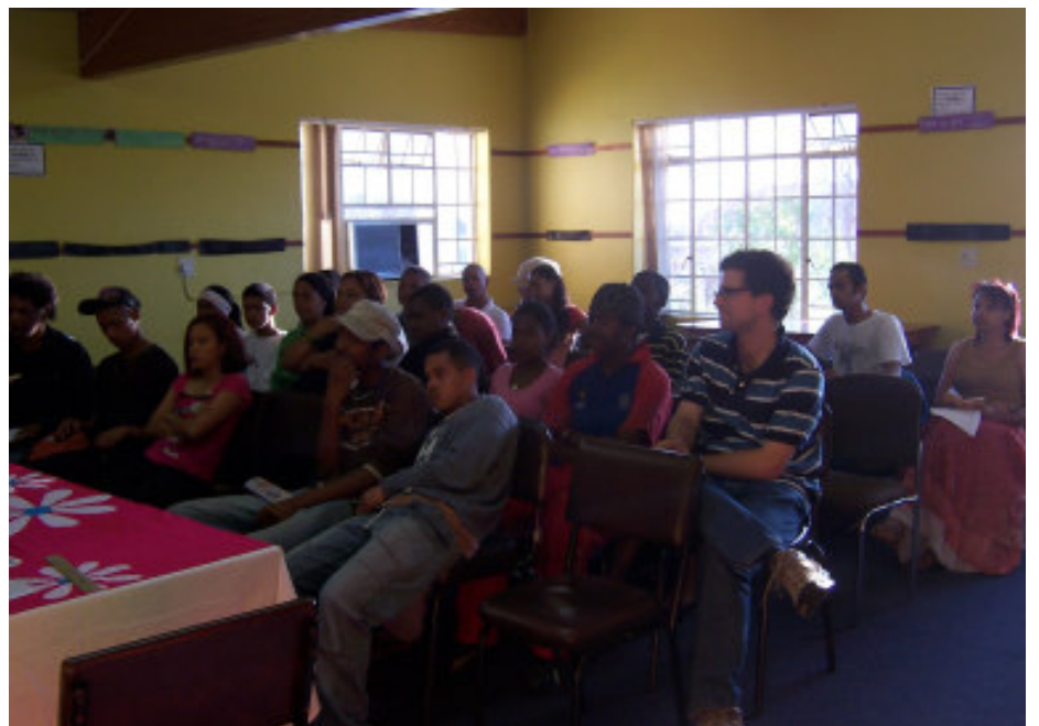
Jugendliche versammeln sich in der New World Foundation zur Sitzung des Jugendforums.